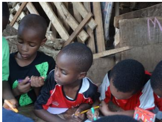
Full konsentrasjon - barna har fått nye fargeblyanter og tegnepapir fra Norge

Tuleeni har vokst mye i løpet av de siste ti årene. Det er en umulighet at alt dette skal bæres av idealismen og arbeidsinnsatsen til én